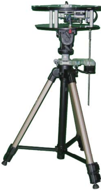
Standard x000 Series 耐荷重 9kg