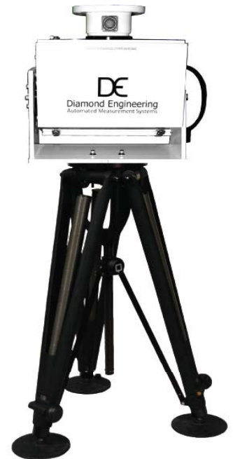
x250 Series Heavy Duty 耐荷重 113kg

360度回転するアルミ製三脚型測定システム。外への持ち出しも苦になりません！ また、重量のある測定物にも対応しております。様々な場面で活躍する製品です。