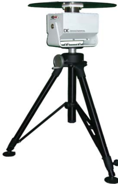
x100 Series Heavy Duty 耐荷重90kg